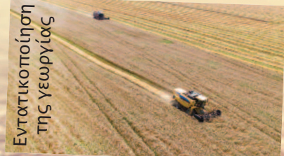
Εντατικοποίηση της γεωργίας