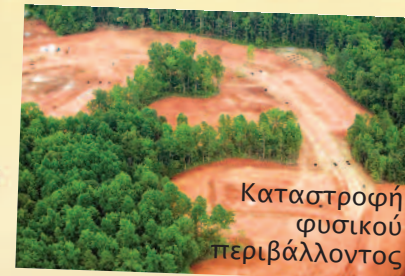
Καταστροφή φυσικού περιβάλλοντος