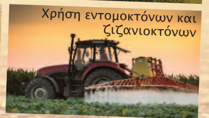
Χρήση εντομοκτόνων και ζιζανιοκτόνων