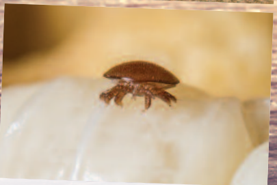
Το άκαρι Varroa destructor πάνω σε μία νύμφη μέλισσας