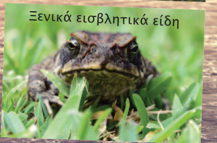
Ξενικά εισβλητικά είδη

Μαζί με όλες τις παραπάνω απειλές τα ξενικά εισβλητικά είδη μπορούν να βλάψουν τη βιοποικιλότητα και τα οικοσυστήματα