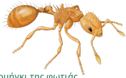
Μικρό μυρμήγκι της φωτιάς Wasmannia auropunctata

Ιθαγενές στη Νότια Αμερική, εισήχθη ακούσια στην Ευρώπη και απειλεί την ντόπια βιοποικιλότητα. Μπορεί επίσης να προκαλέσει αναφυλακτικά σοκ στους ανθρώπους μέσω του δηλητηριώδους τσιμπήματος του.