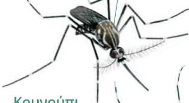
Κουνούπι του κίτρινου πυρετού Aedes aegypti