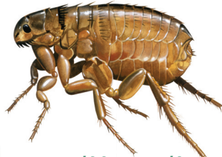
Ψύλλος σκύλου Ctenocephalides canis

Ιθαγενές στην Ευρώπη, το οποίο εισήχθη ακούσια στην Κύπρο. Τρέφεται με πέντε διαφορετικά αυτοφυή ή εισαγόμενα είδη αρωματικών φυτών όπως δεντρολίβανο, φασκόμηλο και λεβάντα.