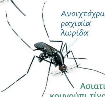
Ασιατικό κουνούπι τίγρης Aedes albopictus

Το ασιατικό κουνούπι τίγρης, και το κουνούπι του κίτρινου πυρετού προέρχονται από την Ασία και την Αφρική, αντίστοιχα, αλλά έχουν μεταφερθεί σε όλο τον κόσμο. Μπορούν να μεταδώσουν ασθένειες όπως ο Ζίκα, ο κίτρινος πυρετός, ο δάγγιος πυρετός και η τσικουνγκούνια.