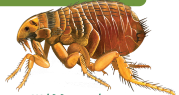
Ψύλλος γάτας Ctenocephalides felis

Οι ψύλλοι των σκύλων και των γατών Ctenocephalides canis και C. felis εικάζεται ότι κατάγονται από την Αφρική. Τα είδη αυτά είναι κοινά παράσιτα σε κατοικίδια και άγρια ζώα. Αυτοί οι ψύλλοι είναι φορείς παθογόνων που προκαλούν τύφο, πυρετό Q και άλλες ασθένειες.